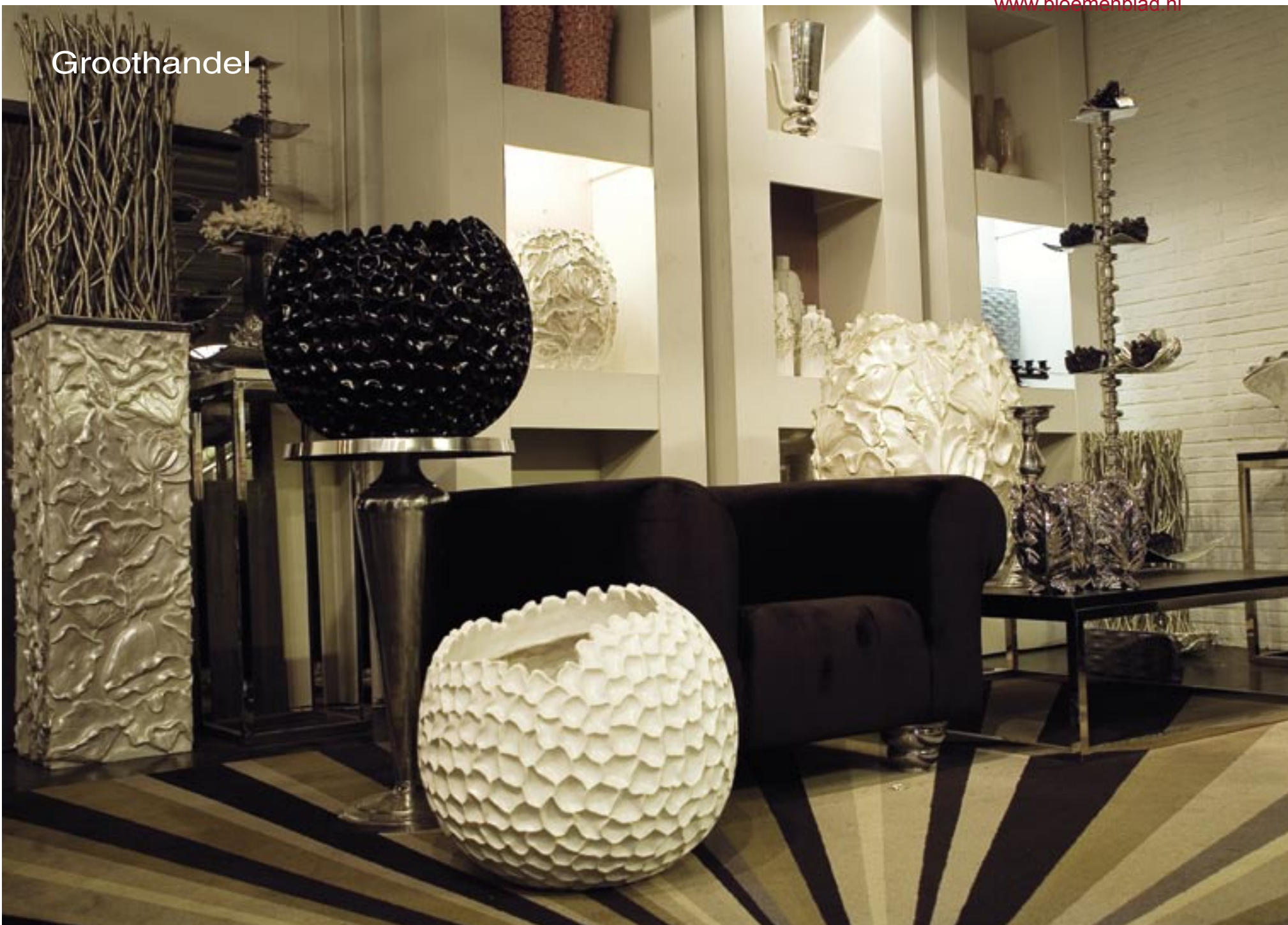
De basiskleuren bij Spilt zijn zwart, wit en aluminium.