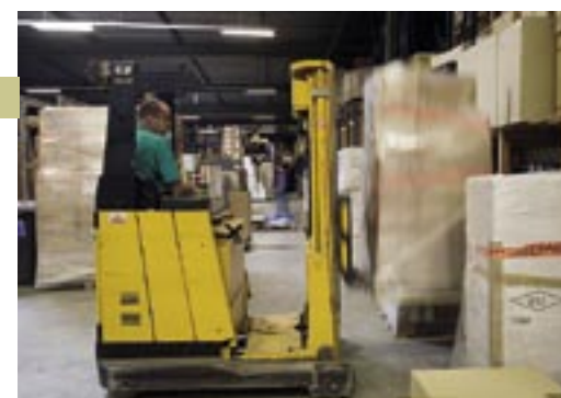
In het magazijn staan nagenoeg alle producten op voorraad. Levering binnen Nederland gebeurt binnen tien dagen. Wat niet meer op voorraad is, kan in vier tot twaalf weken worden nageleverd.