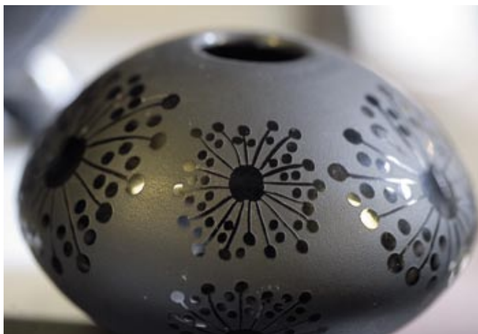
Deze glazen vaasjes zijn er in diverse modellen en uitvoeringen. Het vaasje met print is 10 cm doorsnede en kost €5,15.