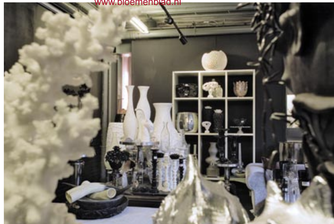
De showroom wordt twee maal per jaar aangepast met nieuwe kleuren op de wanden en vloer. De producten worden nog vaker gewisseld. In de showroom is slechts een deel van de duizenden producten te zien. Spilt is op zoek naar een ander pand om de showroom onder te brengen, zodat klanten beter ontvangen kunnen worden.