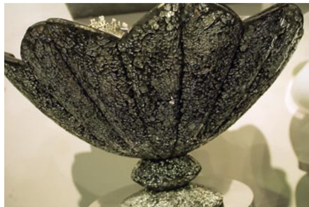
De schaal van polyraisin met mozaïekglas maakt deel uit van de nieuwe collectie. De prijs is nog niet bekend.