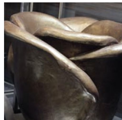
De grote roos van terracotta is er in brons en zwart. De doorsnede is 1,20 m en de inkooprij voor bloemisten is €275.