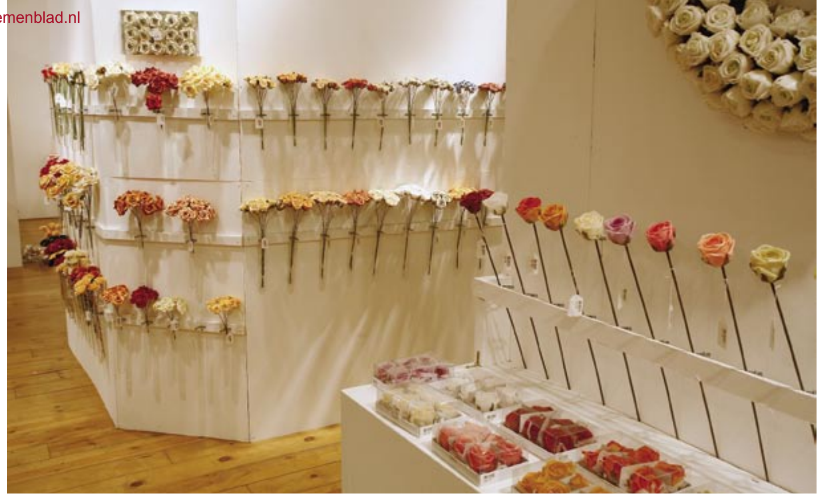
De waxrozen rechts op de foto zijn gemaakt van katoen en daarna in wax gedompeld. Met name de witte rozen met een groen hart en de helemaal groene exemplaren zijn populair.