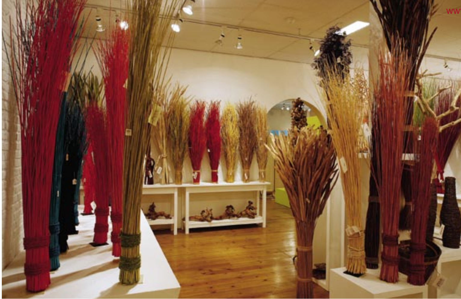
Takken en bladeren geveerd, gevlokt of naturel staan in groten getale in de showroom. Tromp: „In de Filippijnen wordt de gehele palmboom gebruikt om er producten van te maken.”